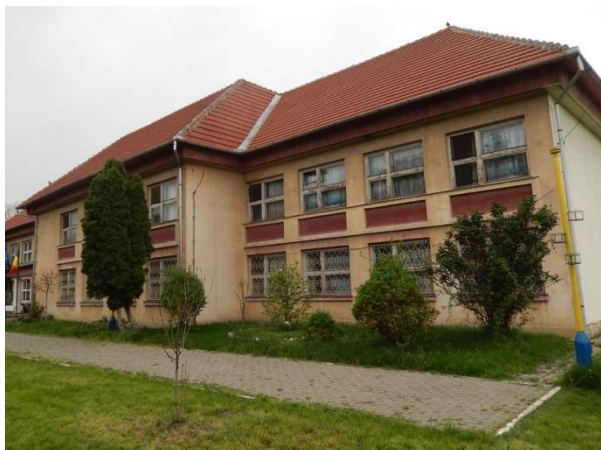
Grădinița cu Program prelungit înainte de proiect (2018)