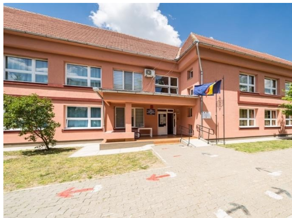
Grădinița cu Program prelungit după proiect (2021)

Există situația în care se realizează un SF cu elemente de DALI, atunci când intervențiile se referă atât la un obiect existent cât și la construcția unui obiect nou.