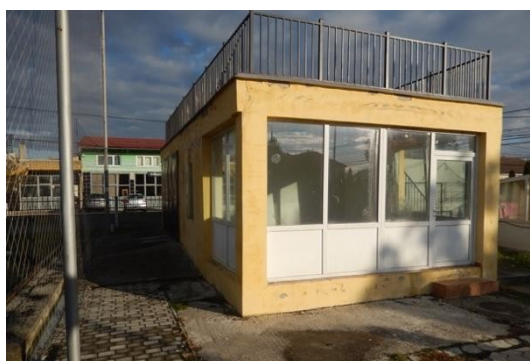
Centru de zi și cantină socială înainte de proiect (2017)

Există situația în care se realizează un SF cu elemente de DALI, atunci când intervențiile se referă atât la un obiect existent cât și la construcția unui obiect nou.