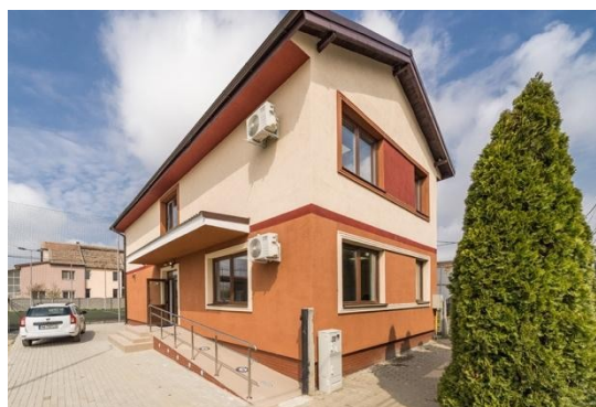
Centru de zi și cantină socială după proiect (2021)

DALI se elaborează pe baza expertizei tehnice a construcției/construcțiilor existente și, după caz, a studiilor, auditurilor ori analizelor de specialitate în raport cu specificul investiției.